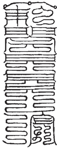
图版 2: 生魂育魄符